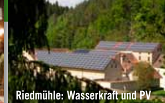
Riedmühle: Wasserkraft und PV