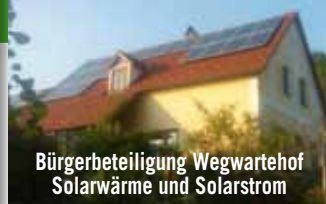
Bürgerbeteiligung Wegwarte Hof Solarwärme und Solarstrom